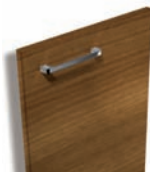
306 Noyer structuré

Tiki Façade polymère satiné avec bouton Pékin chromé brillant.