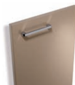
158 Havane brillant