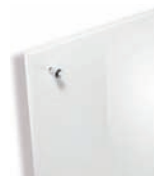
171 Laque blanc brillant

Wali Façade laque blanc brillant avec bouton Saga chromé brillant.