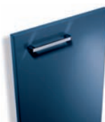
356 Outremer brillant

Miami Façade laque blanc brillant avec bouton Pékin chromé brillant.