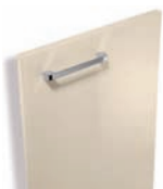
225 Sable brillant