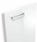
044 Blanc brillant

Paris Façades stratifiés brillant avec poignée chromé brillant.