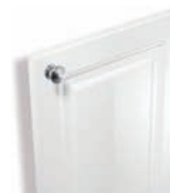
171 Laque blanc brillant

Miami Façade laque blanc brillant avec bouton Pékin chromé brillant.