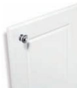
187 Blanc satiné

Tiki Façade polymère satiné avec bouton Pékin chromé brillant.