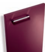
556 Cassis brillant