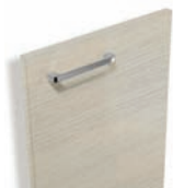
784 Chêne glacier structuré

Delhi Façades décor bois avec poignée chromé brillant.