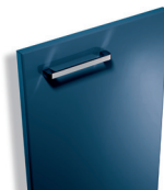
356 Outremer brillant