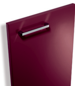
556 Cassis brillant