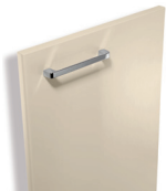
735 Sable brillant