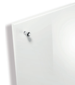
112 Blanc brillant

Façade vernie blanc brillant avec bouton Saga chromé brillant.