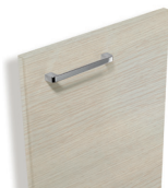
784 Chêne glacier structuré

Façades décor bois avec poignée chromé brillant.