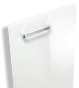
050 Blanc brillant

Façades mélaminé brillant avec poignée chromé brillant.