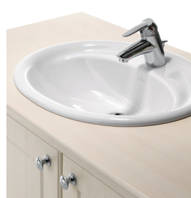
6 coloris au même prix