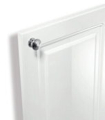
171 Laque blanc brillant

Façade laque blanc brillant avec bouton Pékin chromé brillant.