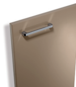
738 Havane brillant