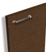
706 Togo cuivré structuré