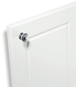
187 Blanc satiné

Façade polymère satiné avec bouton Pékin chromé brillant.