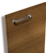
306 Noyer structuré