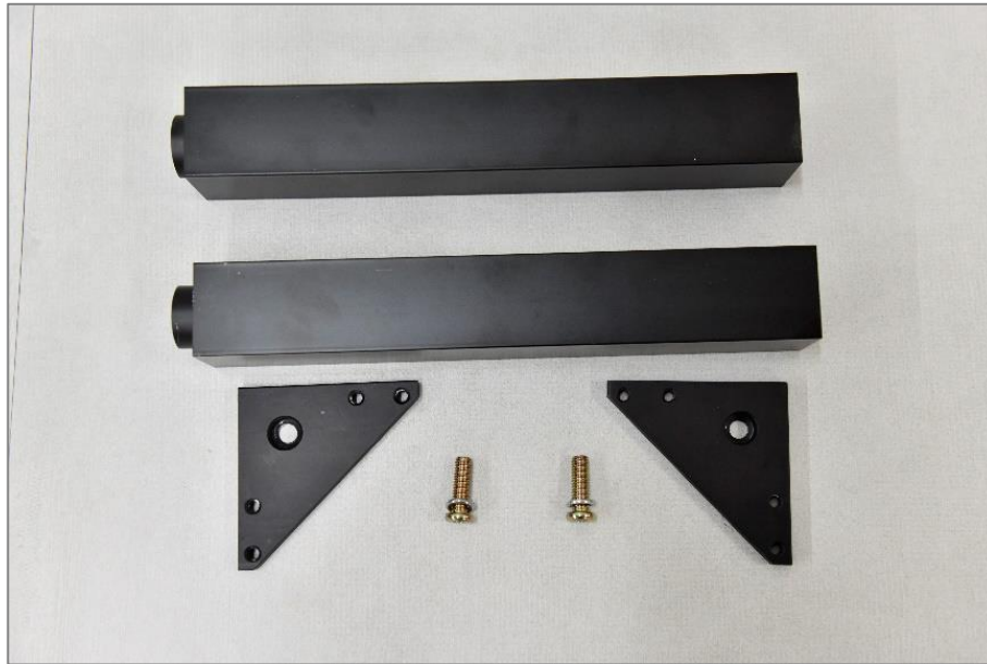
La quincaillerie fournie

Les outils fournis se trouvent dans l'emballage.