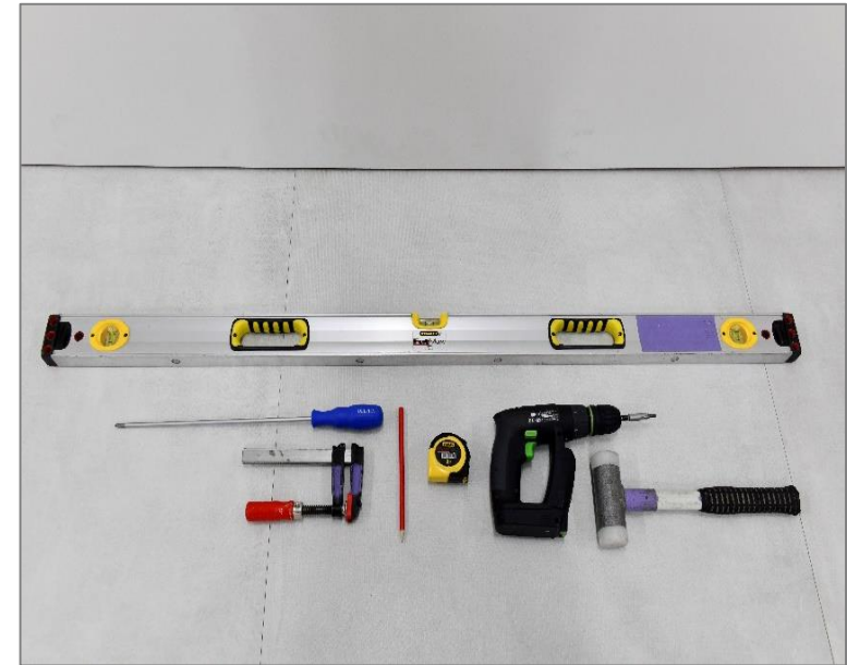
Les outils non fournis

Outils principaux nécessaires pour le montage de votre ensemble.