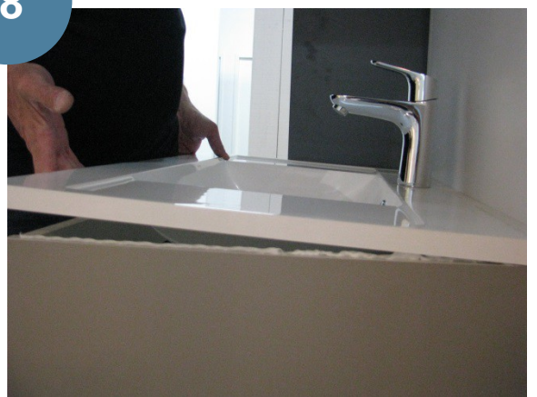
Fixer le plan