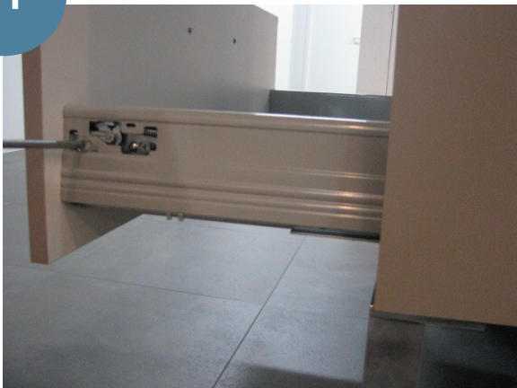
Régler les façades