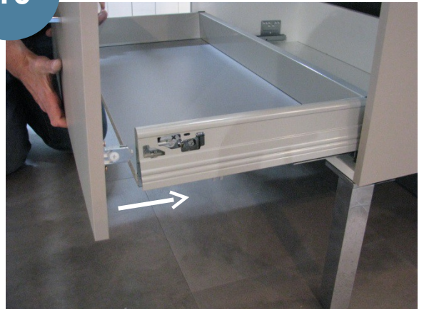
Mise en place des façades