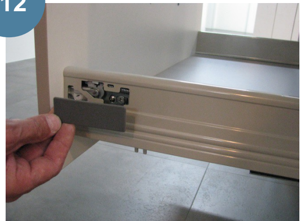
Mise en place du cache