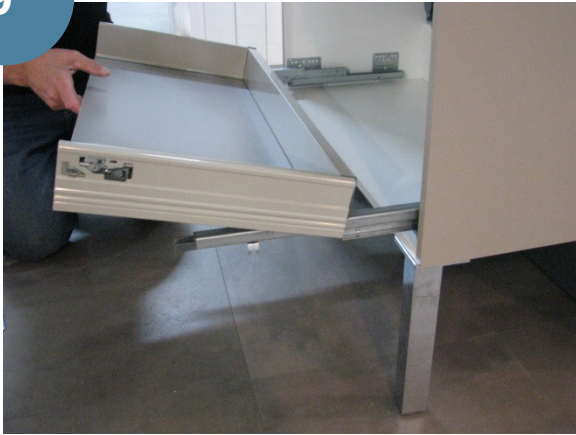
Mise en place des tiroirs coulissants