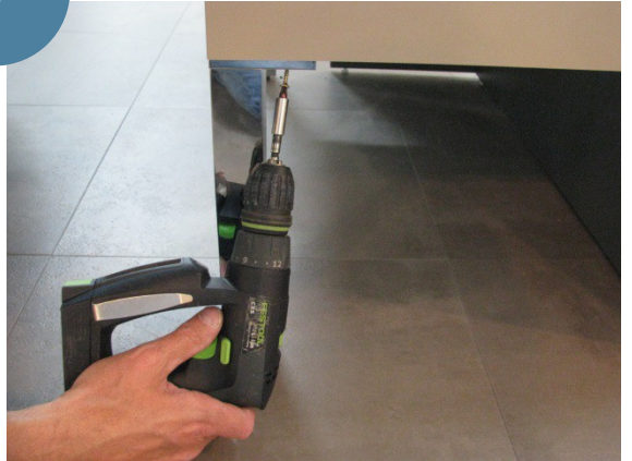
Fixer les pieds