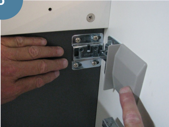
Mise en place des caches