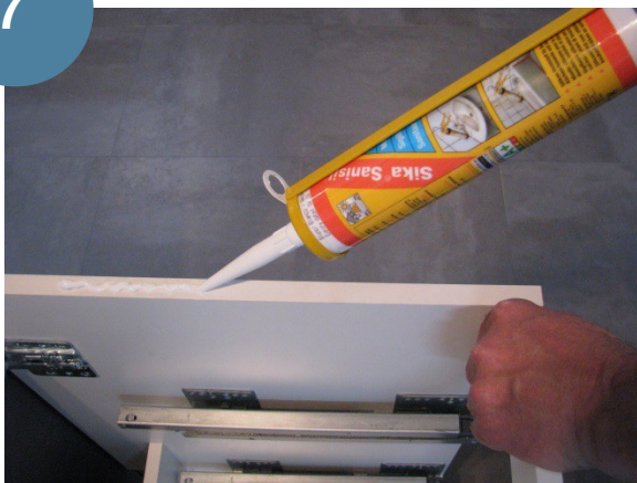
Appliquer du silicone sur le côté du meuble