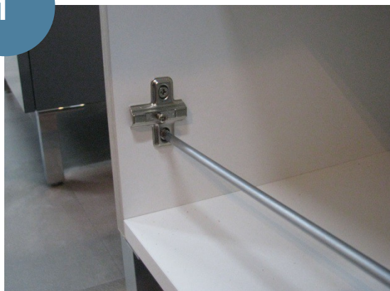
Fixer les platines