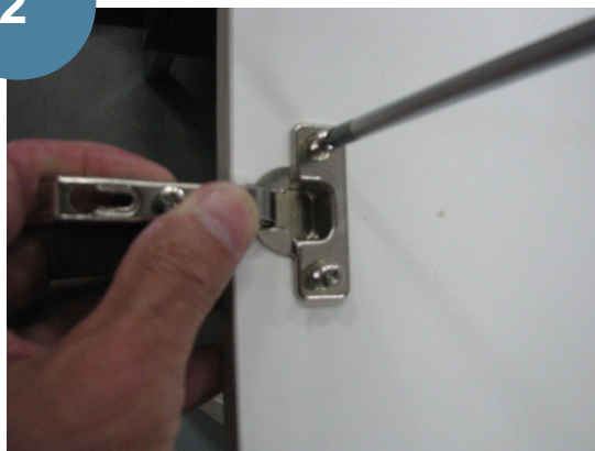
Monter les charnières